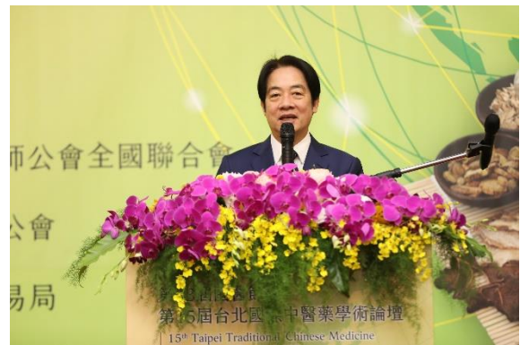
副總統賴清德先生致詞