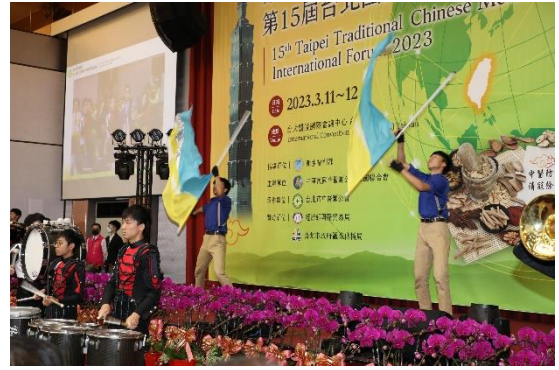
大會開幕式表演(二)