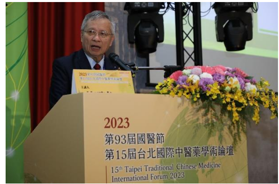
中央研究院林昭庚院士大會演講