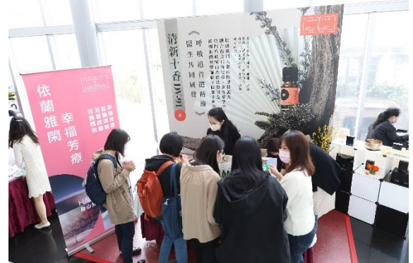
大會資訊展示區(二)