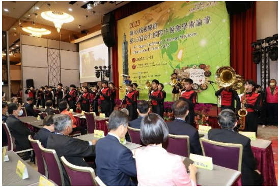
大會開幕式表演(一)