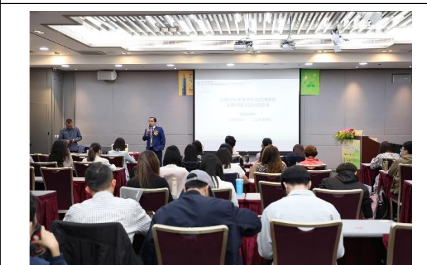
韓國美顏針特別講座