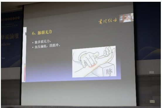
南京中醫藥大學博士生導師黃煌教授視訊演講