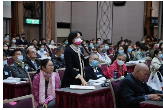
論壇大會與會醫師提問