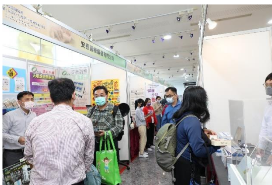
大會資訊展示區(一)