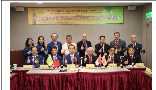
與新加坡中醫中藥聯合會簽署 MOU