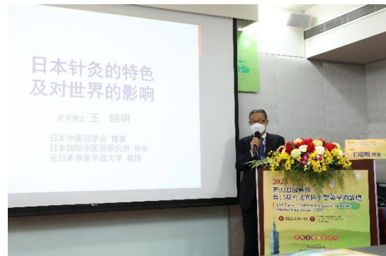
帝京平成大學健康學科大學院王曉明教授演講