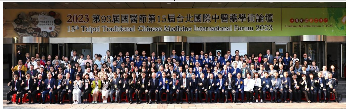
國外人士與會大合照