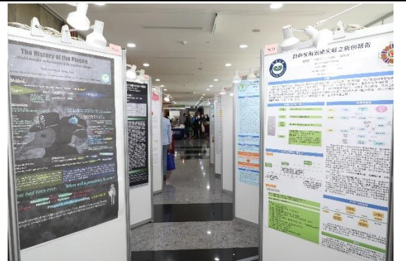
大會學術壁報展示區(二)