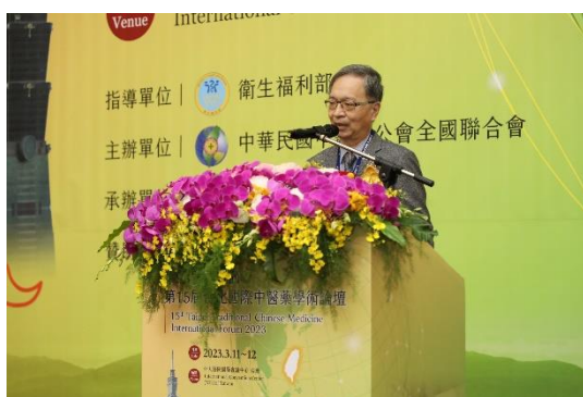
衛生福利部薛瑞元部長致詞