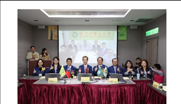
與澳門中醫生公會視訊連線簽署 MOU