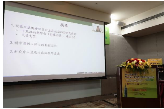
新加坡中醫學院副院長陳坤耀博士視訊演講