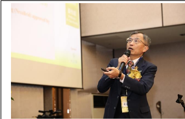
衛福部中醫藥司司長黃怡超教授大會演講