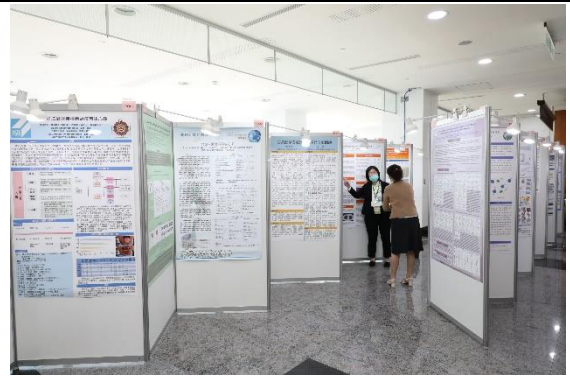
大會學術壁報展示區(一)