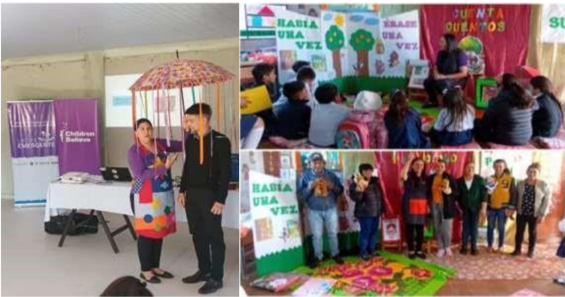
照片說明：與家長及兒童共同進行說故事工作坊