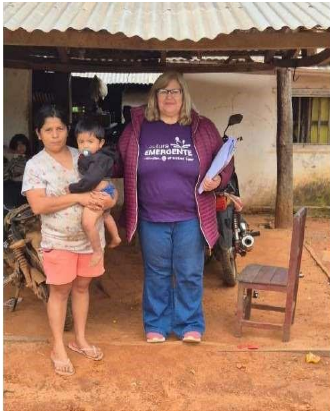
照片說明：對 Fertiono 家庭進行追蹤訪視