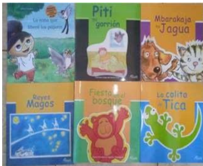
照片說明：教材包內容為兒