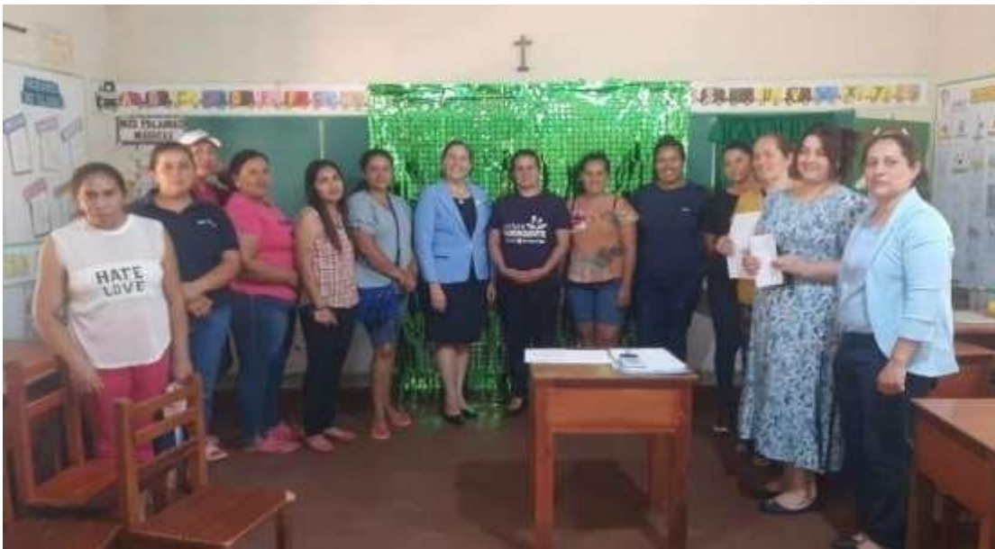
照片說明：於學校辦理家長座談會