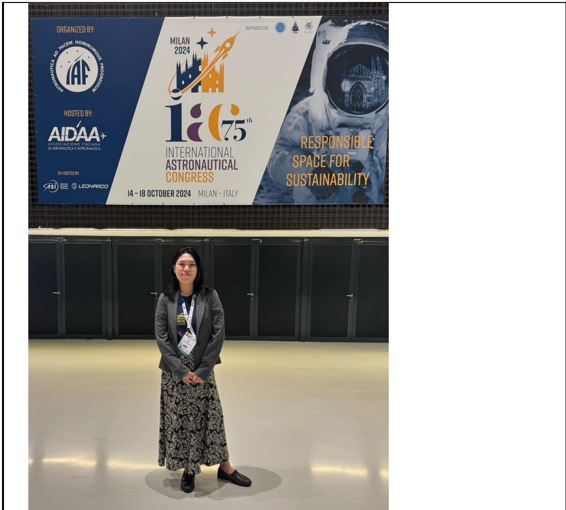
5. 社團法人臺灣太空世代發展協會/ 2024/10/9-20/ 義大利米蘭/ 參與第 75 屆國際太空大會暨 第 22 屆太空青年峰會 4 在大會上與英德法國際友人交流