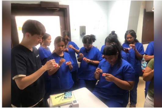
義大醫療遠赴密克羅尼西亞培育當地醫衛人才不遺餘力。

義大醫療積極配合外交部及衛福部國際合作組等政府單位政策，自2013年起與義守大學共同致力於學士後醫學系外國學生專班的訓練，協助友邦如帛琉、馬紹爾以及吐瓦魯等太平洋島國，培養具國際醫療水準與服務熱忱的國際人才，提升醫療服務品質。近幾年與我國保持友好關係的密克羅尼西亞，雖然沒有邦交，但兩國在醫療合作上，也開始密切交流，展現我國醫療實力。