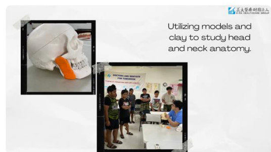
Utilizing models and clay to study head and neck anatomy.

https://www.facebook.com/EDA.Taiwan/posts/pfbid0ytQUed2DZr2NQJPd2F7iafZ9rEVLZurkuLF9pTLB9iS77HhHrQj2CHfyQ7B6o8zVl