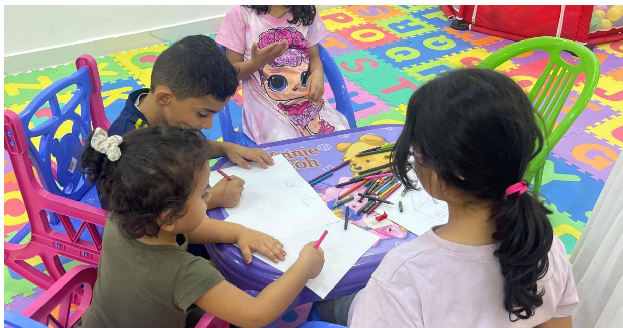
▲ 兒童小綠洲提供安全學習與活動空間

中心也與國際救援委員會(IRC)展開為期兩年的「點亮未來計畫」，共同提升ECD方案的教學品質與成效評估。2026年初正式啟動「歡迎芝麻」(Ahlan Sim Sim)培訓課程，結合芝麻街教育理念，以遊戲與互動陪伴孩子學習與成長，同時強化教師評估能力。未來IRC也將持續提供實地督導與支持，讓更多兒童與家庭受惠。在動盪環境中，中心攜手社區與家庭，陪伴孩子擁有健康、快樂的童年。