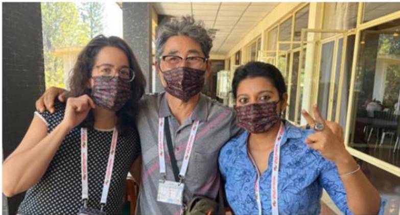
Face masks with the Servas logo (thanks to Servas Taiwan team!)