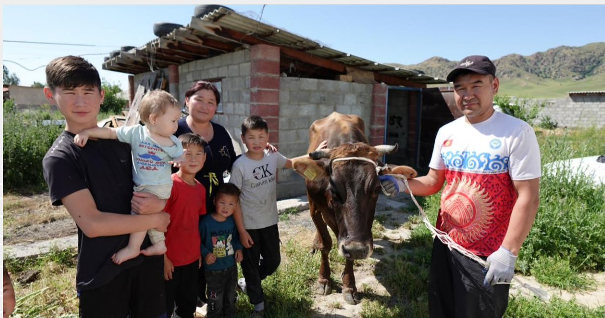
▲ 甫收到牲口的扶助家庭

除了乳品收益，母牛平均每年可生產1頭小牛，母羊則生產大約3至5頭小羊。中心會讓家庭保留一部分的牛犢和羊羔，他們可以持續飼養或是對外販售以賺取收入；另一部分則分送給參與「牲」生不息方案的新進家庭，讓更多有需要的家庭能夠受惠，在社區裡同心協力發展畜牧。儘管目前社區的整體規模有限，家戶所擁有的經濟動物仍不是很多，但可以預期未來規模和效益會越來越龐大，甚至帶動當地的經濟循環。吉爾吉斯家扶中心也將持續關注家庭的實際需求，和他們攜手度過前方的艱難和挑戰！