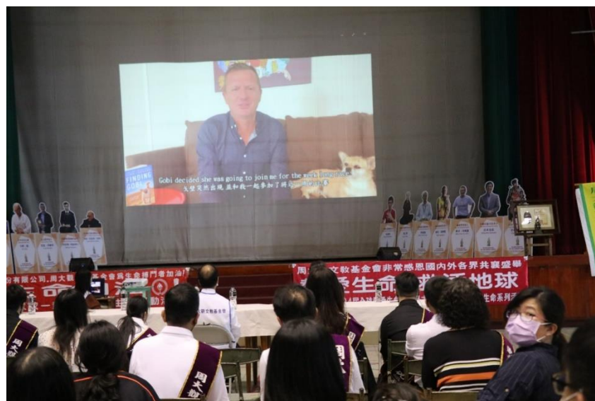
「熱愛生命·救活地球—2021年第24屆全球熱愛生命獎章得主會師受獎交流活動」—英國澳裔超馬選手迪昂·萊納德(Dion Leonard) 透過國際視頻與在場貴賓、道明高中師生、全球熱愛生命獎章得主交流分享。