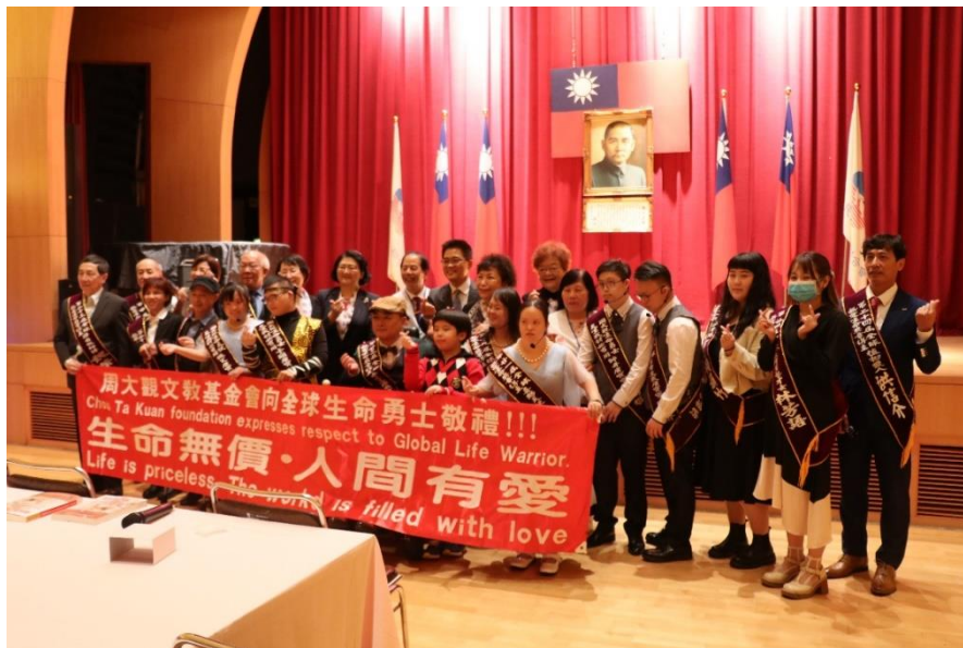
「活出愛—2021年全球熱愛生命獎章得主送愛婦聯會交流分享活動」