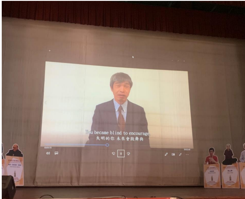
「熱愛生命·救活地球—2021年第24屆全球熱愛生命獎章得主會師受獎交流活動」—美籍日裔全盲水手岩本光弘(Mitsuhiro Iwamoto)透過國際視頻與在場貴賓、道明高中師生、全球熱愛生命獎章得主交流分享。