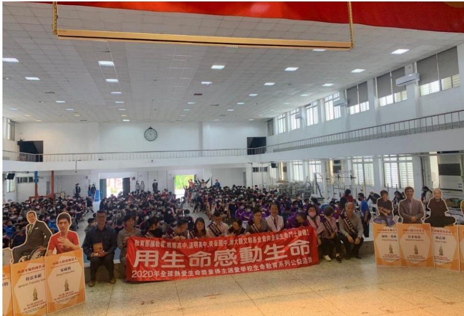
「手機不會告訴你的事—全球熱愛生命獎章得主一行送愛花蓮讀出希望·再奏希望樂章」—全球熱愛生命獎章得主一行與與美崙國中師生、貴賓合影。