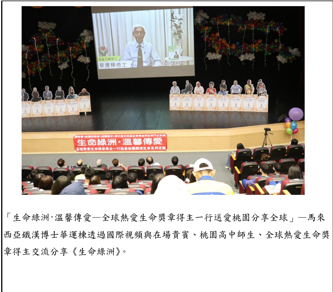
「生命綠洲·溫馨傳愛—全球熱愛生命獎章得主一行送愛桃園分享全球」—馬來西亞鐵漢博士華運棟透過國際視頻與在場貴賓、桃園高中師生、全球熱愛生命獎章得主交流分享《生命綠洲》。