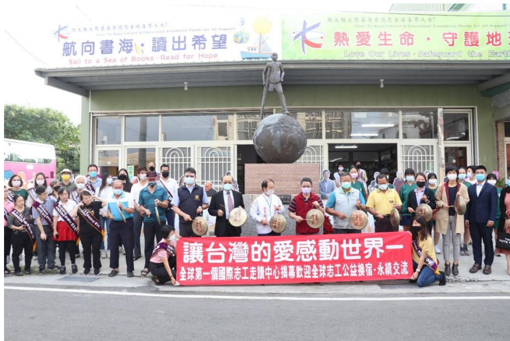
「讓台灣的愛感動世界—周大觀讀出希望中心暨愛童之家揭幕歡迎全球志工永續交流」—全球第一個國際志工走讀中心揭幕，大家一起帶動閱讀，閱讀生命，閱讀希望，閱讀愛無國界，閱讀無限可能。