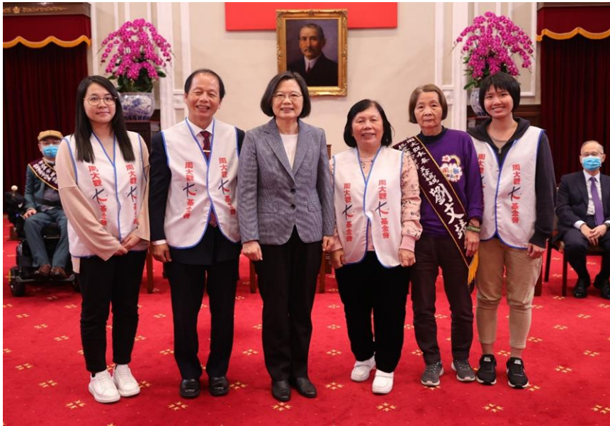
「讓台灣的愛感動世界—2021 年全球生命鬥士會師授獎關懷生命系列公益活動」—總統蔡英文與本會創辦人周進華、董事長郭盈蘭等基金會同仁合影。