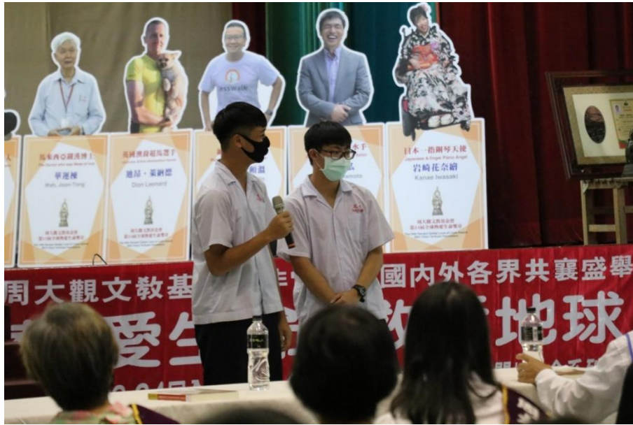
「熱愛生命·救活地球—2021年第24屆全球熱愛生命獎章得主會師受獎交流活動」—全球熱愛生命獎章得主 V. S. 道明高中學生生命對話。