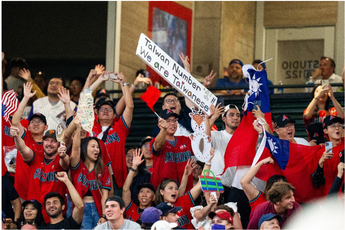
3. 2024 年美國職棒亞利桑那響尾蛇隊台灣日：社團法人台灣創新棒球協會 /2024.09.13/鳳凰城/2024 年美國職棒亞利桑那響尾蛇隊台灣日