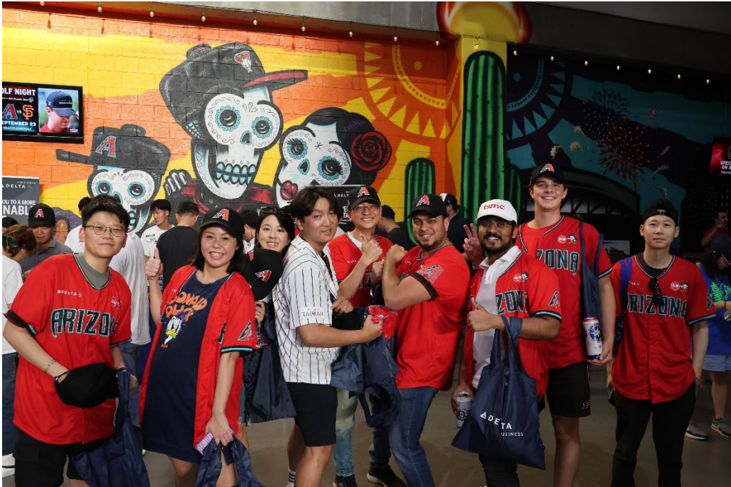
5. 2024 年美國職棒亞利桑那響尾蛇隊台灣日：社團法人台灣創新棒球協會 /2024.09.13/鳳凰城/2024 年美國職棒亞利桑那響尾蛇隊台灣日