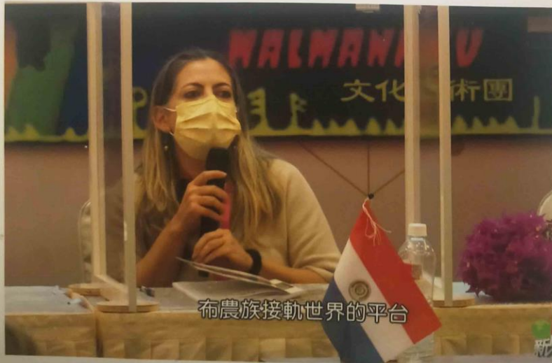
布農族接軌世界的平台